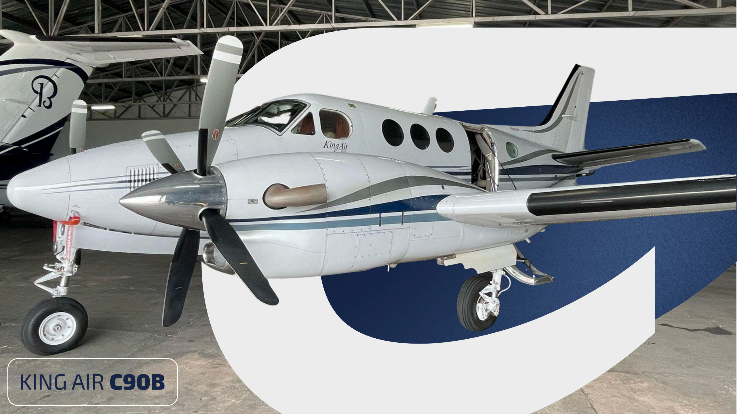
KING AIR C90B