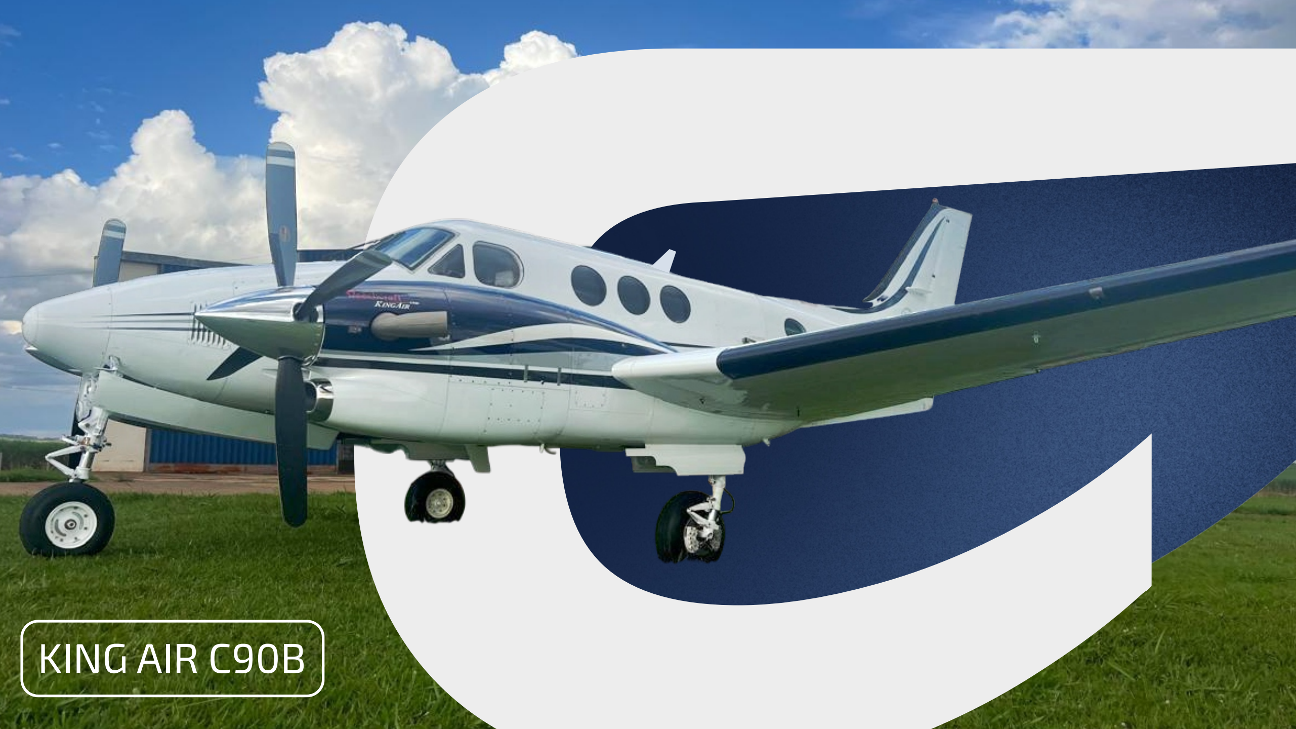
KING AIR C90B